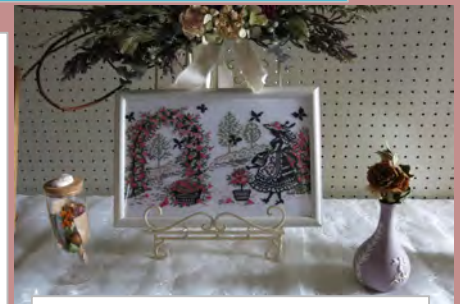
クロスステッチ刺繍